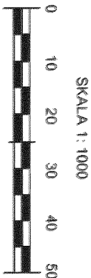
RYСУNEK ZMIANY PLANU

Załącznik nr 1 do Uchwały Nr LXVII/745/10 Rady Miasta Oświęcim z dnia 26 maja 2010 roku