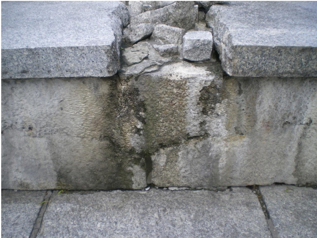
Fot. 14. Pomnik Odzyskania Niepodległości, plac między ulicami: Generała Jarosława Dąbrowskiego i Ludwika Solskiego w Oświęcimiu. Stan przed konserwacją. Zbliżenie na płytę pomnika od strony północnej.