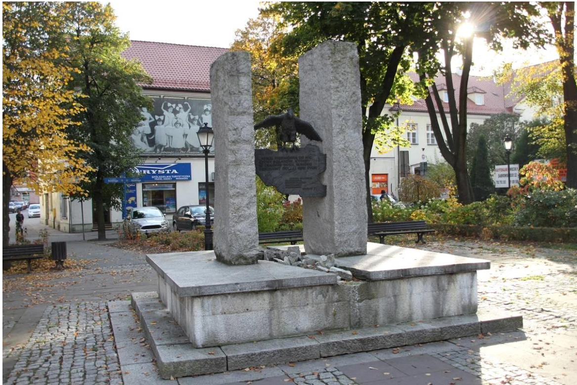
Fot. 1. Pomnik Odzyskania Niepodległości, plac między ulicami: Generała Jarosława Dąbrowskiego i Ludwika Solskiego w Oświęcimiu. Stan przed konserwacją. Widok od strony północnej.

zdjęcia wykonała Danuta Majewska-Motyl maj 2018