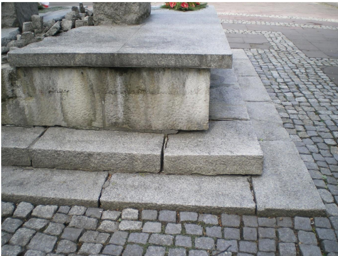
Fot. 6. Pomnik Odzyskania Niepodległości, plac między ulicami: Generała Jarosława Dąbrowskiego i Ludwika Solskiego w Oświęcimiu. Stan przed konserwacją. Zbliżenie na południowo-wschodni narożnik płyty pomnika.