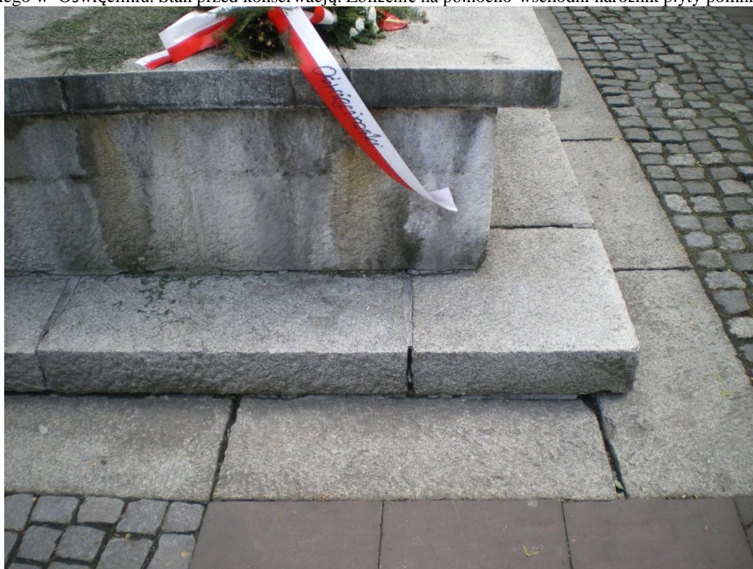
Fot. 11. Pomnik Odzyskania Niepodległości, plac między ulicami: Generała Jarosława Dąbrowskiego i Ludwika Solskiego w Oświęcimiu. Stan przed konserwacją. Zbliżenie na północno-zachodni narożnik płyty pomnika.