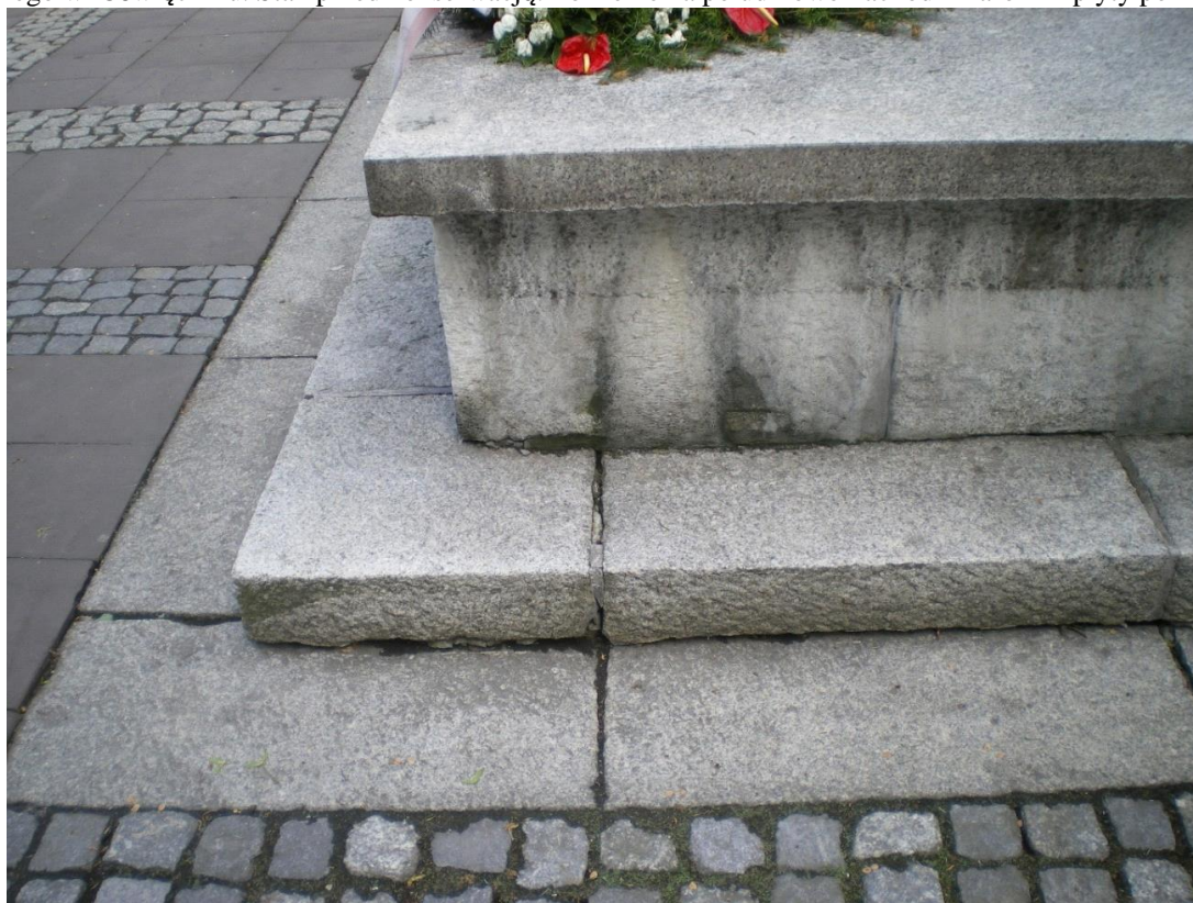
Fot. 9. Pomnik Odzyskania Niepodległości, plac między ulicami: Generała Jarosława Dąbrowskiego i Ludwika Solskiego w Oświęcimiu. Stan przed konserwacją. Zbliżenie na północno-zachodni narożnik płyty pomnika.