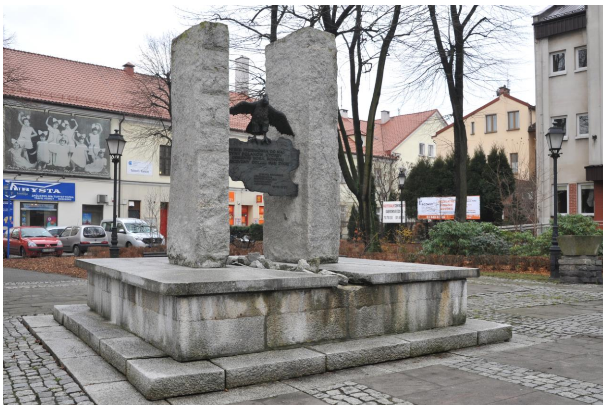
i wizualizacja nowej wersji orła trzymającego szarfę.