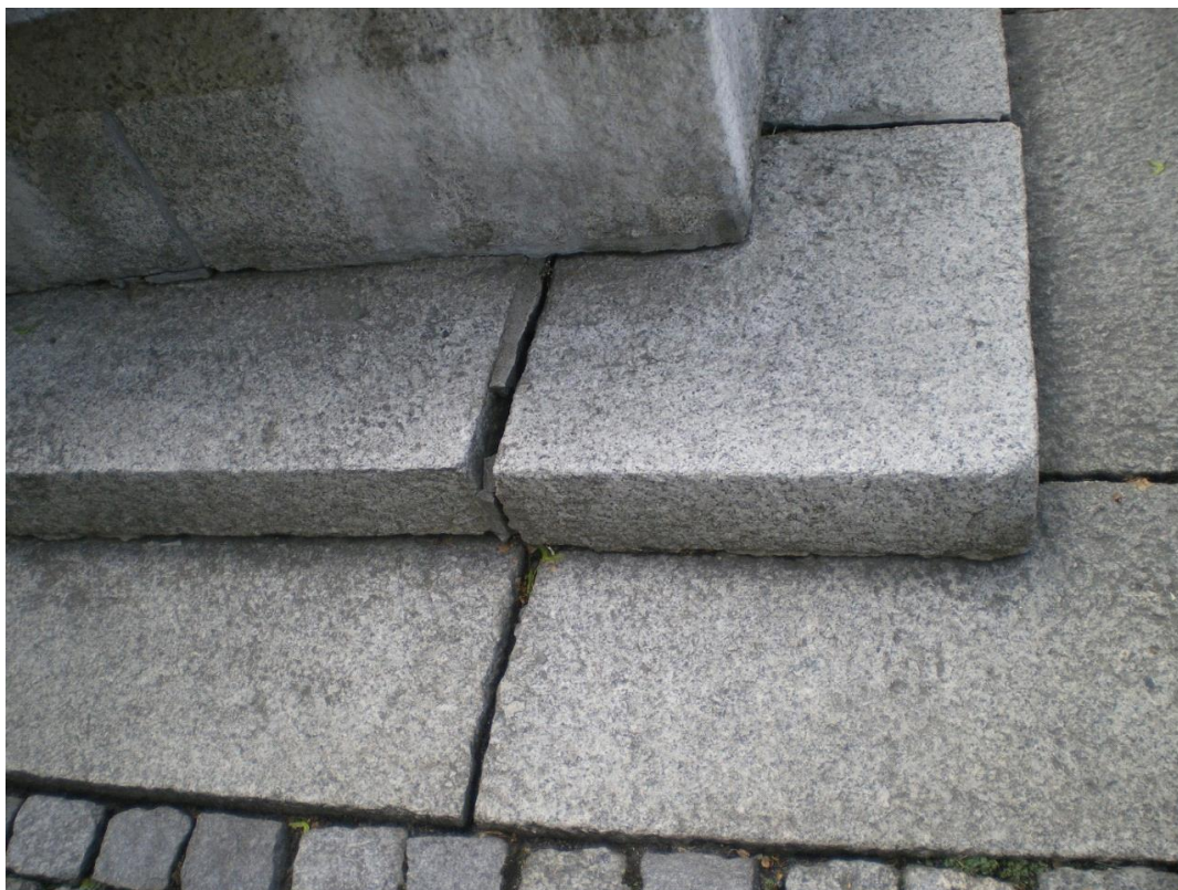
Fot. 12. Pomnik Odzyskania Niepodległości, plac między ulicami: Generała Jarosława Dąbrowskiego i Ludwika Solskiego w Oświęcimiu. Stan przed konserwacją. Zbliżenie na północno-wschodni narożnik płyty pomnika.