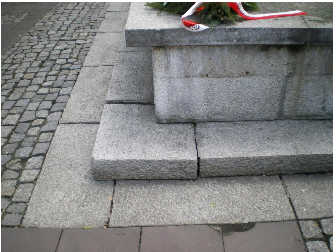
Fot. 10. Pomnik Odzyskania Niepodległości, plac między ulicami: Generała Jarosława Dąbrowskiego i Ludwika Solskiego w Oświęcimiu. Stan przed konserwacją. Zbliżenie na północno-wschodni narożnik płyty pomnika.