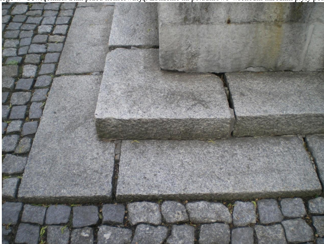
Fot. 7. Pomnik Odzyskania Niepodległości, plac między ulicami: Generała Jarosława Dąbrowskiego i Ludwika Solskiego w Oświęcimiu. Stan przed konserwacją. Zbliżenie na południowo-zachodni narożnik płyty pomnika.