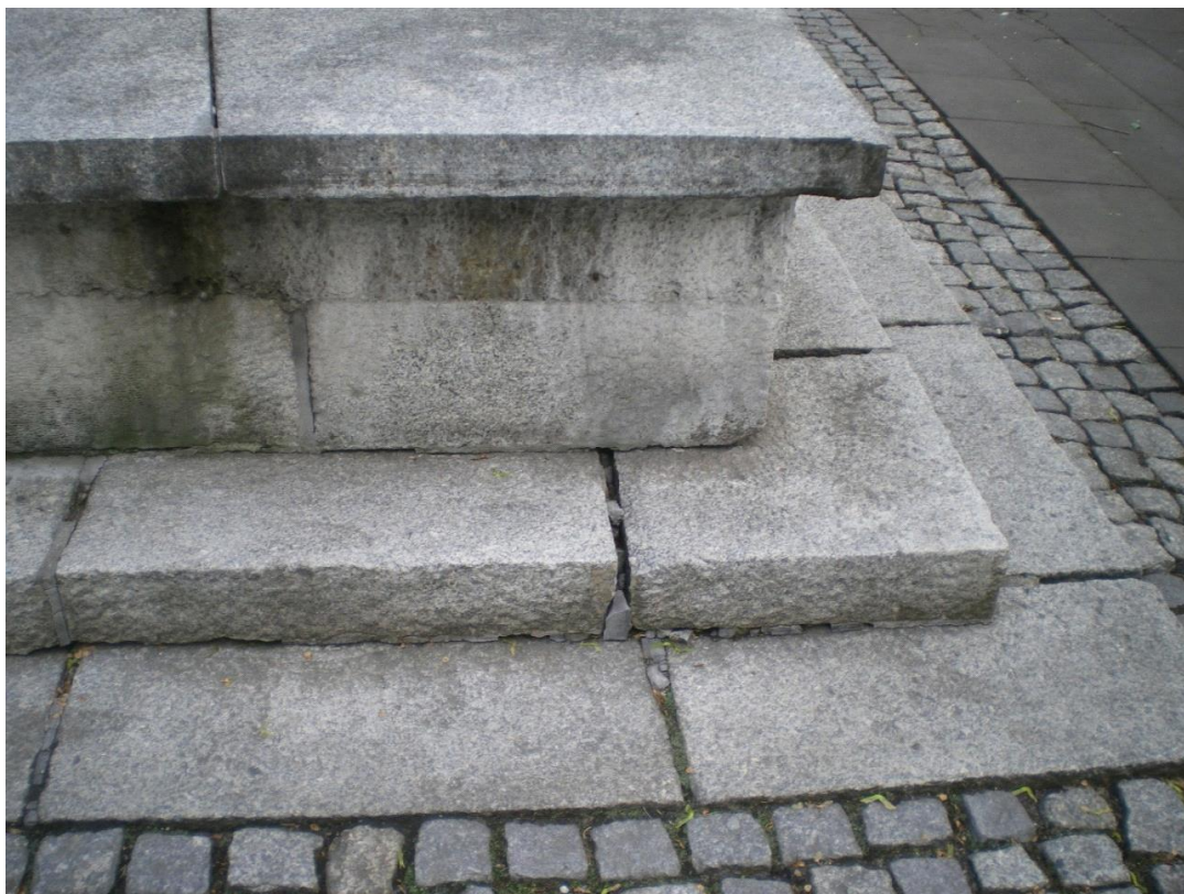
Fot. 8. Pomnik Odzyskania Niepodległości, plac między ulicami: Generała Jarosława Dąbrowskiego i Ludwika Solskiego w Oświęcimiu. Stan przed konserwacją. Zbliżenie na południowo-zachodni narożnik płyty pomnika.