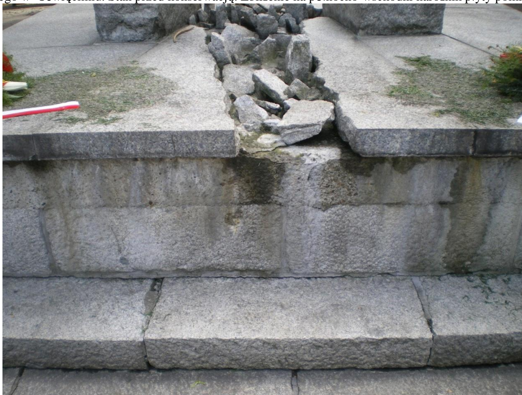
Fot. 13. Pomnik Odzyskania Niepodległości, plac między ulicami: Generała Jarosława Dąbrowskiego i Ludwika Solskiego w Oświęcimiu. Stan przed konserwacją. Zbliżenie płytę pomnika od strony północnej.